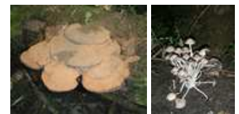
Saprotrophes (lignicole et humicole)

Elle stocke du carbone et contribue, comme toutes les forêts, à maintenir une bonne qualité d'air. De plus, elle est un réservoir potentiel de molécules pour les médicaments.