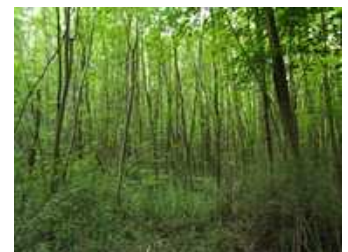
Ambiance de forêt alluviale

Elle constitue des espaces naturels de proximité. Elle participe à la définition du paysage et contribue à l'ambiance du territoire. Elle peut être le support d'activités récréatives ( randonnée, parcours gymnique, sentier d'interprétation... ). Les imbrications avec les plans d'eau en font aussi un lieu privilégié pour la chasse, la pêche et la baignade.