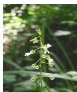
Circée de Paris