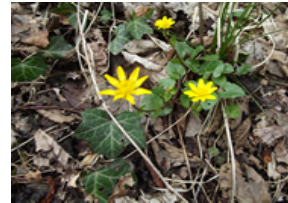
Ficaire fausse renoncule