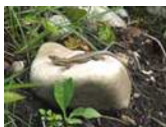
Lézard des murailles