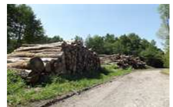
Stockage de bois

Elle produit du bois d'œuvre et du bois énergie commercialisables qui peuvent fournir un revenu aux propriétaires.