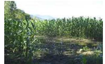
Maïs en lisière de forêt alluviale

Elle contribue à limiter les effets néfastes de certaines activités ( utilisation d'engrais, de pesticides et concentrations de métaux lourds... ). Elle contribue de ce fait à la qualité des cours d'eau et des eaux souterraines.