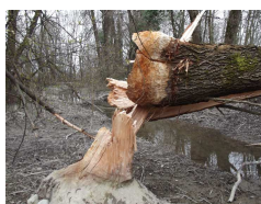
Travail de castor