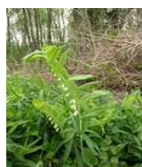
Sceau de Salomon