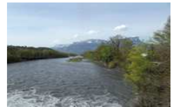
L'Isère, un affluent majeur du Rhône

La forêt alluviale participe à la préservation des zones humides sur lesquelles elle se développe souvent ( plus de 50% de la forêt alluviale du fond de vallée est en zone humide ).